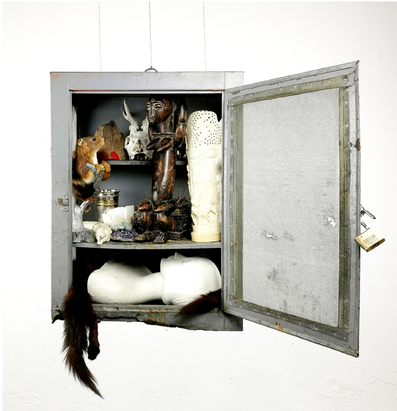
Quand tu épouses l'argent, le diable pond un œuf dans ton garde-manger, 2021. Trophées divers (ivoires, fourrures, bijoux...), nid, œuf en pierre, métal, bois, cadenas, 42 x 65 x 61 cm.