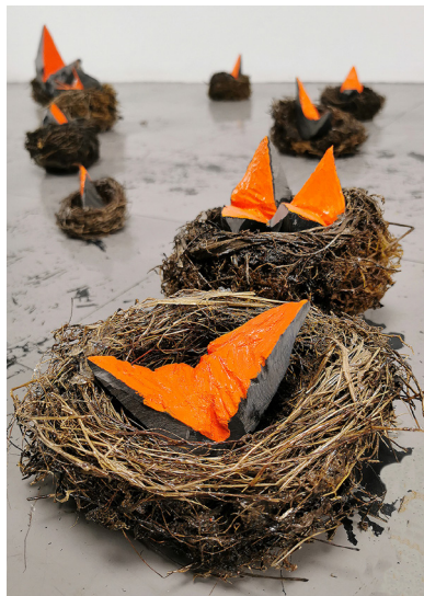
[PAGE DE GAUCHE ET CI-CONTRE] Les Avides , 2022-2025. nids d'oiseaux, résine acrylique, marbre noir, huile, dimensions variables, oeuvre évolutive.