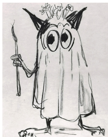
[CI-DESSUS] Il est temps d'aller prendre l'air , 2025. Série, fusain sur papier, 42 x 52 cm.