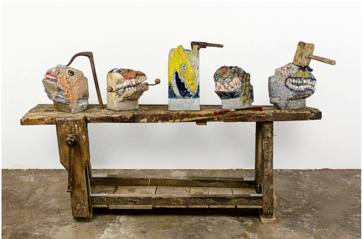
Petits carnivores familiers, 2020. Marbre gris, huile, cire, papier imprimé, bois, outils divers, 210 x 65 x 130 cm.