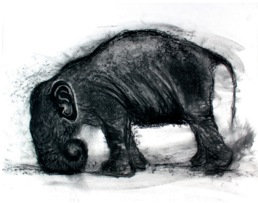
Faire face /stéréotypie fusain sur papier 50 x 65 cm 2017