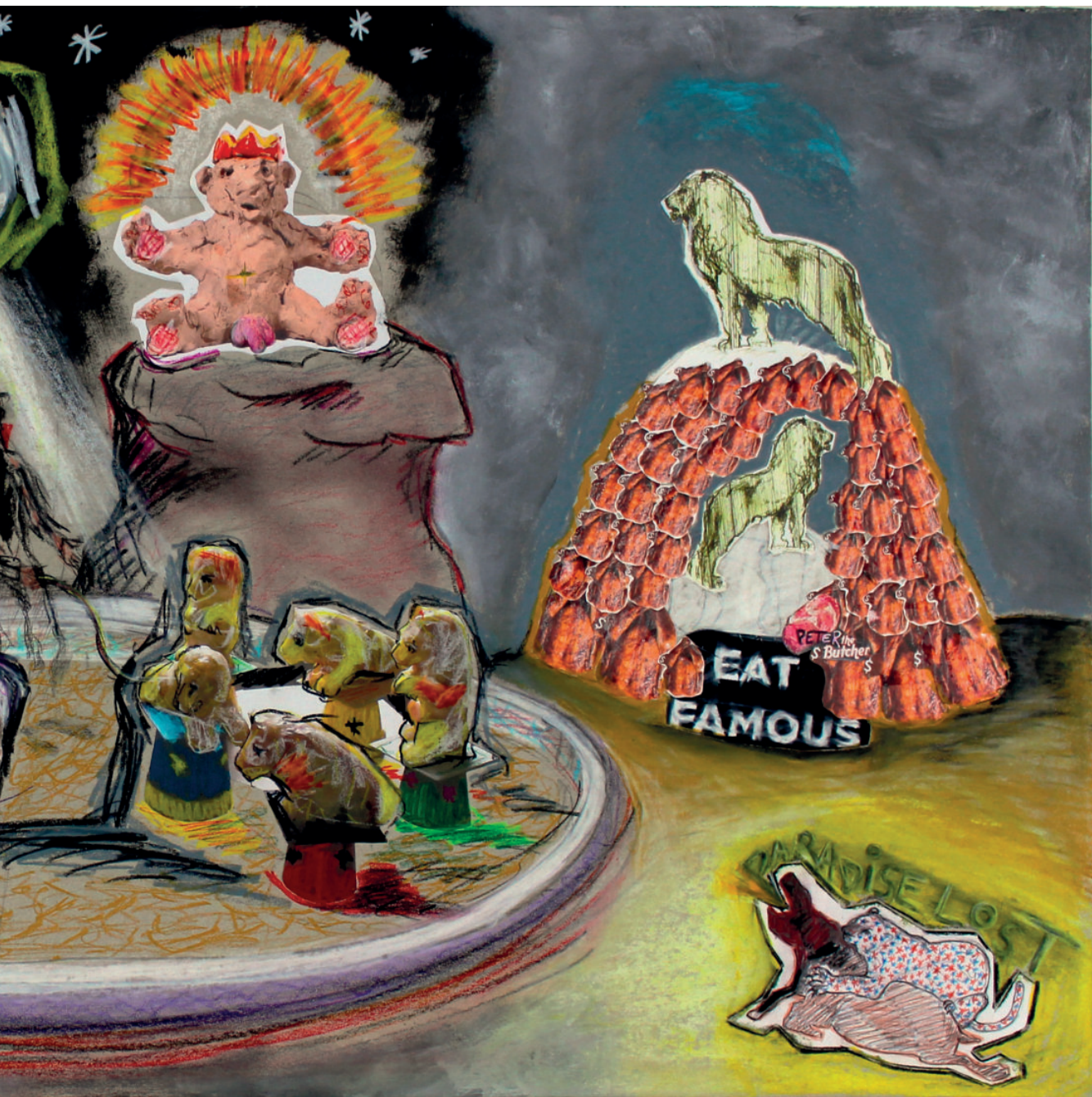
Step into paradise , technique mixte sur carton contrecollé sur panneau, 60 x 120 x 2 cm, 2019