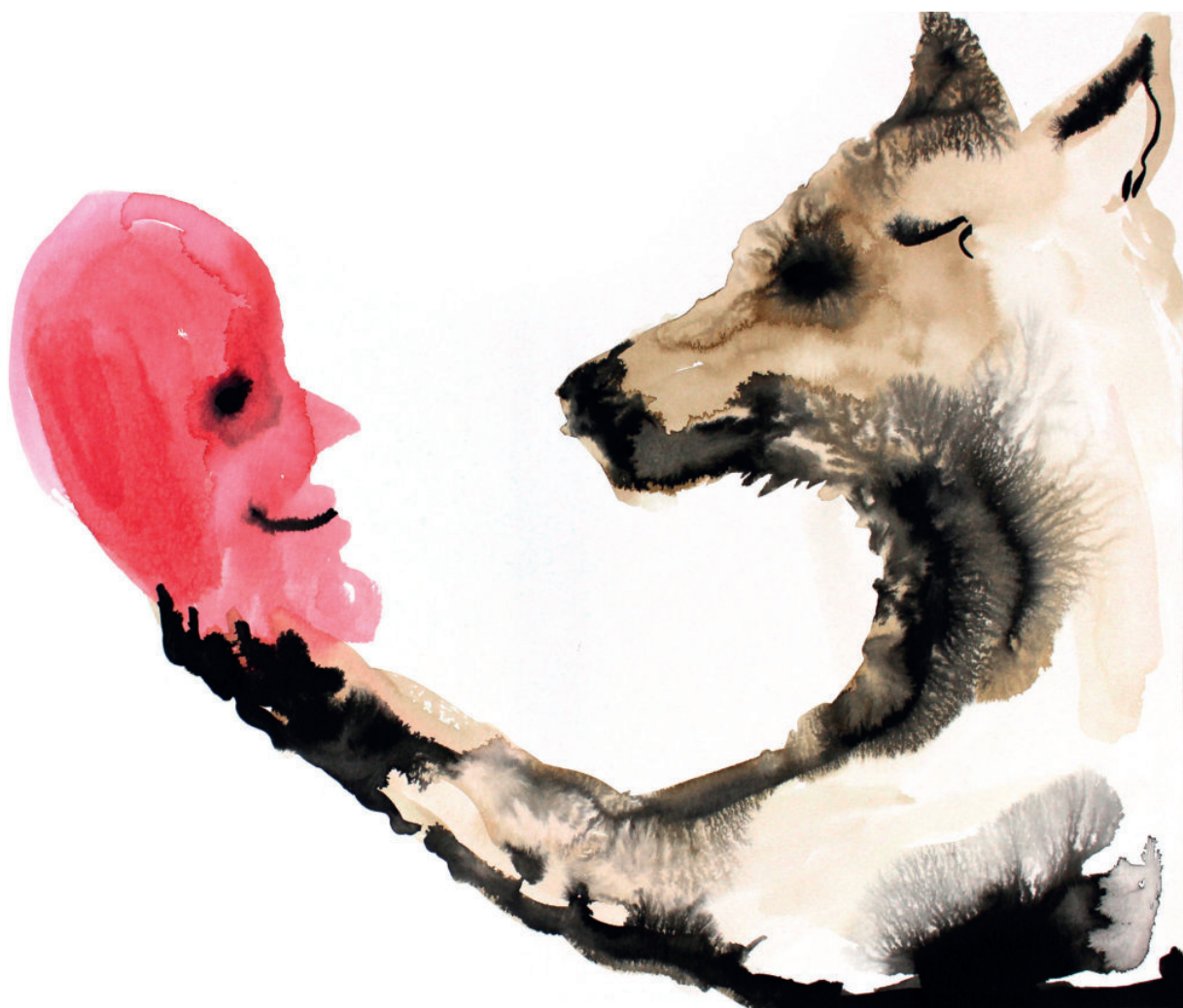
Le masque, série encre et brou de noix sur papier 30 x 40 cm 2018