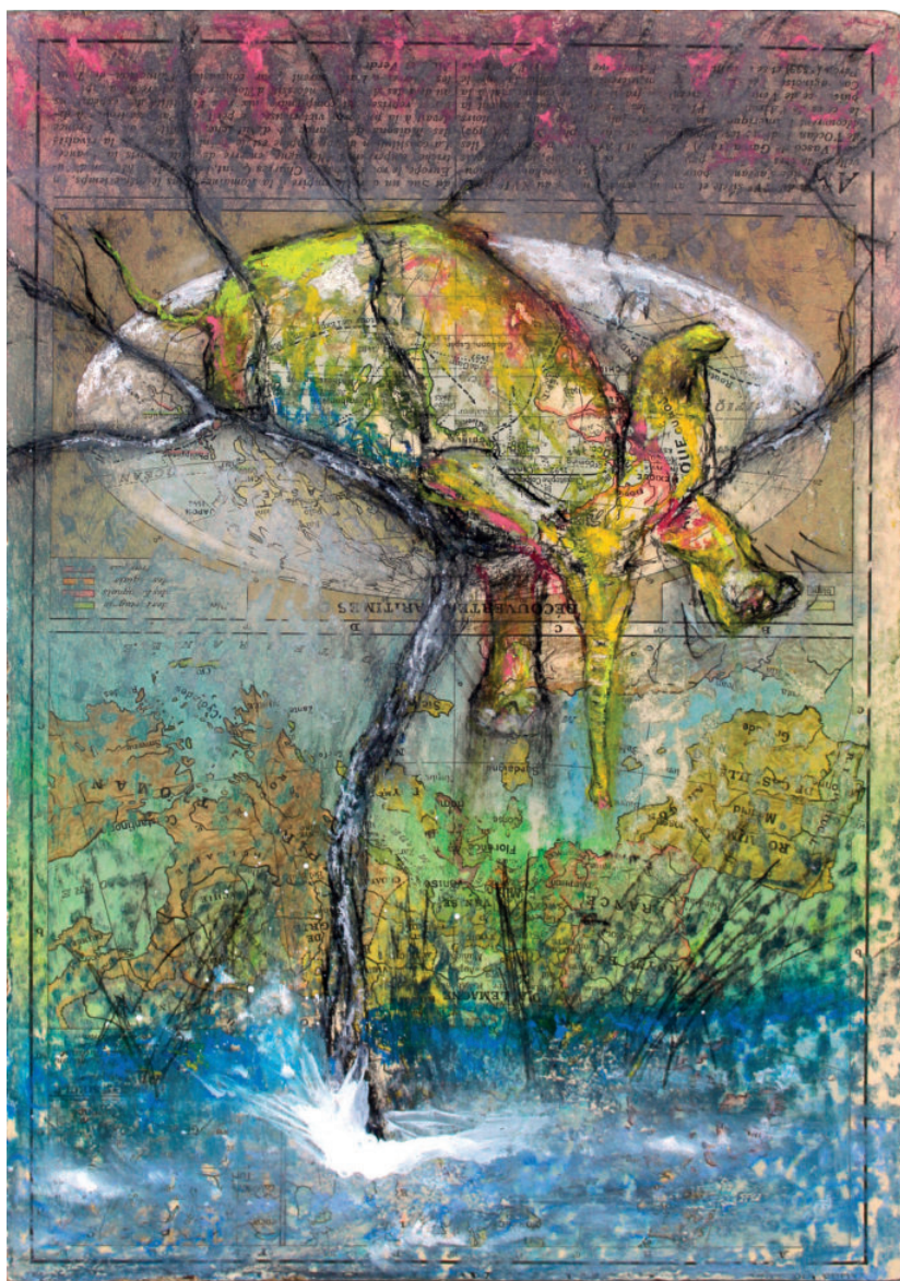
Montée des eaux (4) , série pastel gras et technique mixte sur page d'atlas contrecollée sur panneau 20 x 29 x 1,6 cm 2017-2018