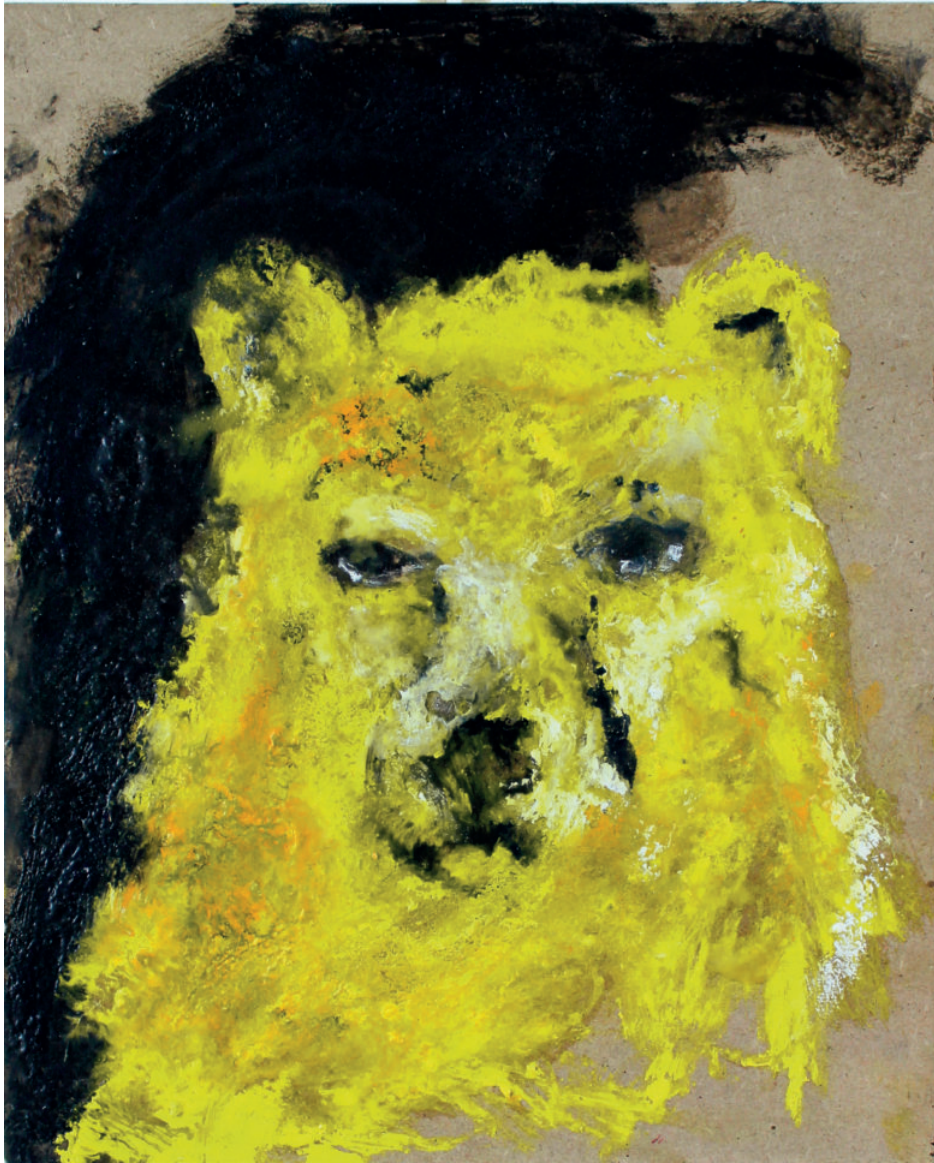
Ours jaune Cire et huile sur panneau 31 x 39 cm 2018