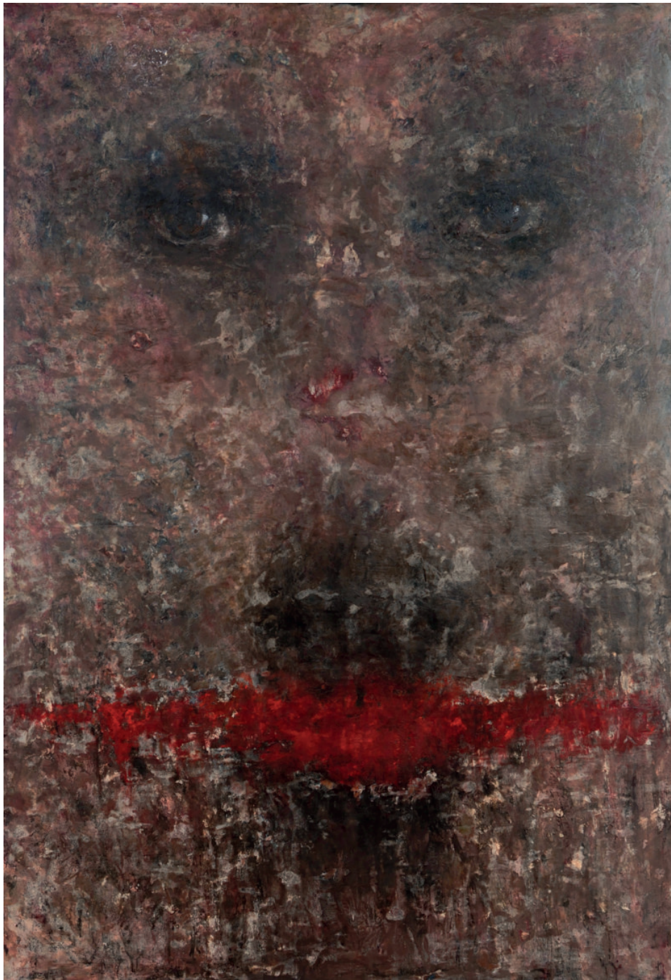
Tu ne (me) dévoreras point cire, huile et fibre sur toile 130 x 195 cm 2015-2016