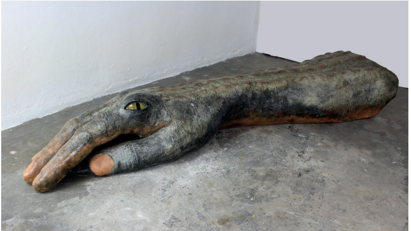
Crocodilus fessus maximus cire colorée et huile sur armature, œil en résine 250 x 66 x 46 cm 2004

Caractéristique de sa démarche artistique, l'hybridation est chez Pierre Fauret une opération de croisement d'éléments issus de mondes divergents et scrupuleusement choisis. Elle est un jeu de construction fondamentalement démiurgique où la divergence des éléments sélectionnés aboutit in fine à une harmonie combinatoire. Cette notion d'harmonie se révèle justement au regardeur, dans ces combinaisons hybrides, par les choix subtils d'éléments organiques s'accouplant dans une justesse fine.