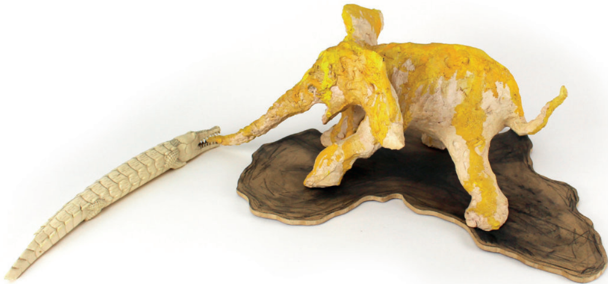
Certains gens ne savent pas ce qui est bon pour eux plâtre et pigments, medium et fusain, crocodile en ivoire # 68 x 40 x 22 cm 2018