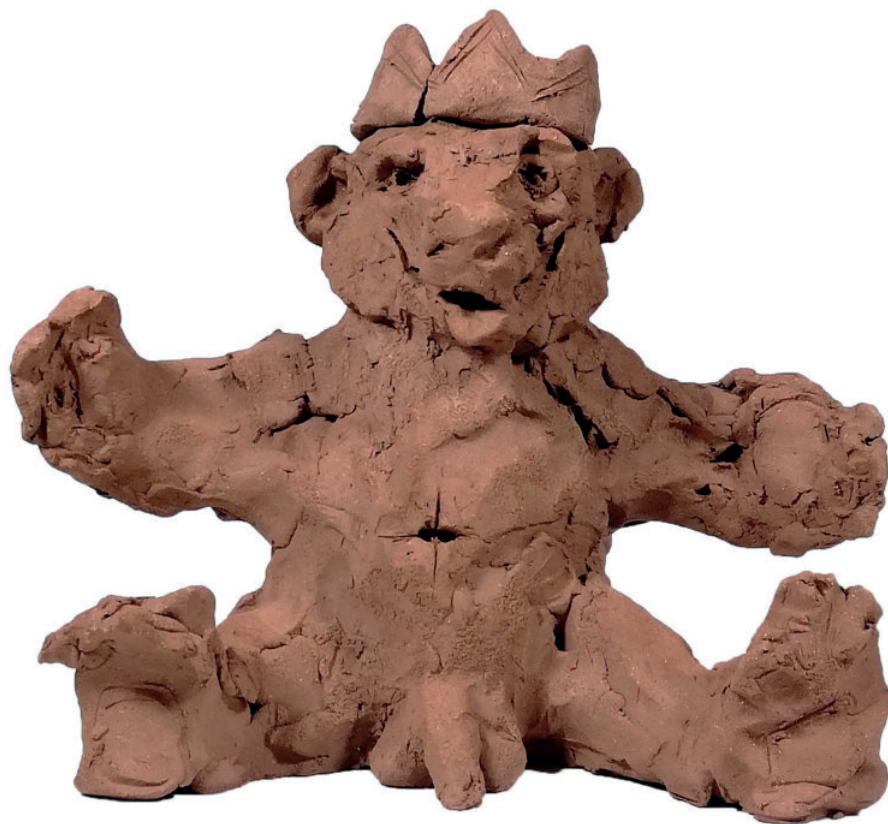
Hospitalité II terre crue 24 x 17 x 21 cm 2018