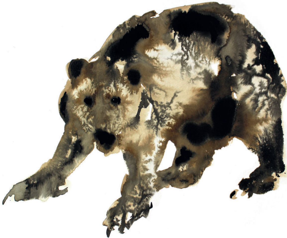
Faire face, série encre et brou de noix sur papier 30 x 40 cm 2018 collection privée