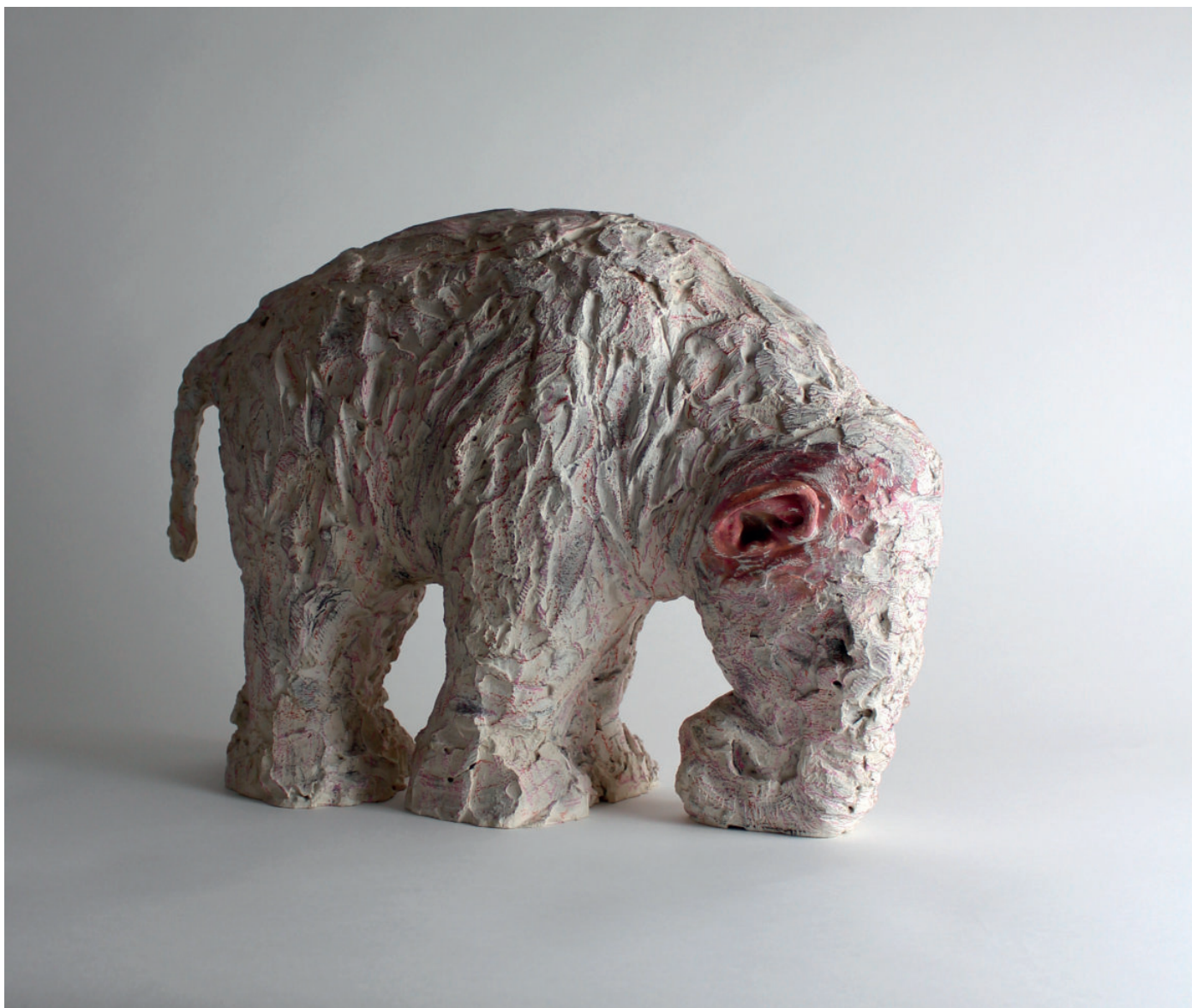
Faire face/stéréotypie plâtre, acrylique et crayons de couleur 48 x 18 x 36 cm 2018