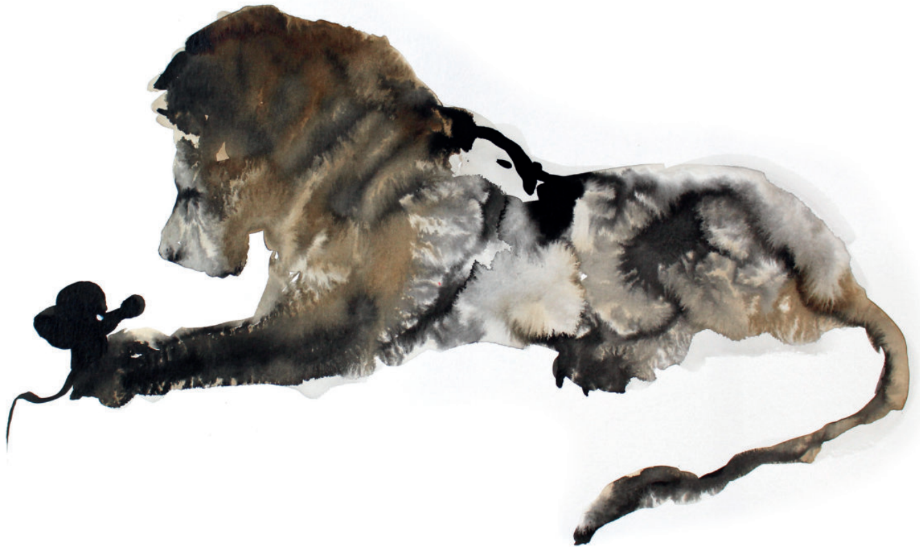
Total control, série encre et brou de noix sur papier 30 x 40 cm 2018