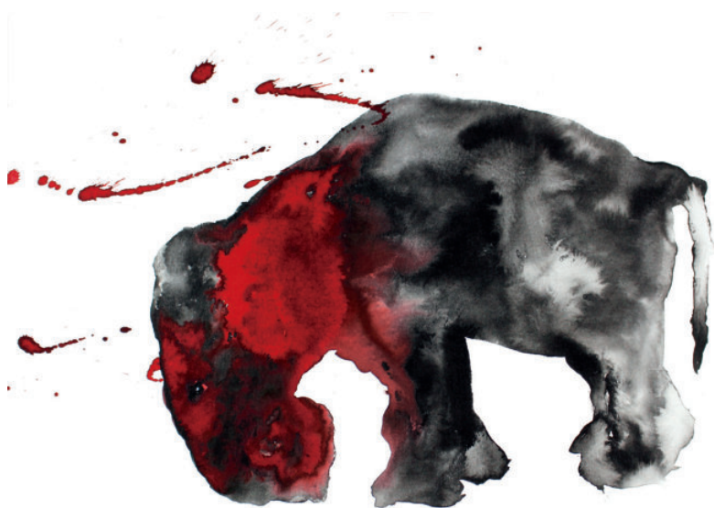
Faire face/stéréotypie encre sur papier 40 x 30 cm 2017