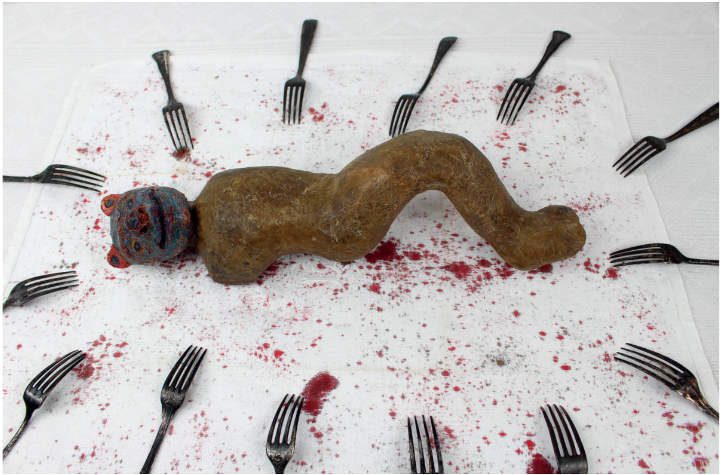
Crocodiles, détail figure avec masque d'ours (cire, fibres, plâtre coloré), encre, fourchettes, nappe damassée, table env. 105 x 88 x 95 cm 2019