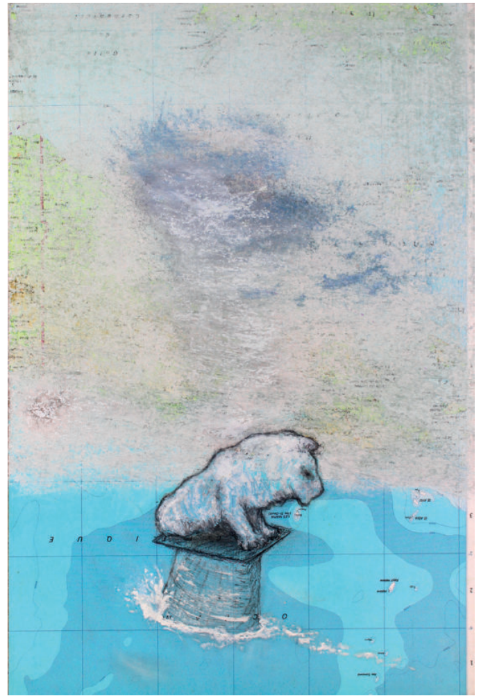
Montée des eaux, série pastel gras et technique mixte sur page d'atlas contrecollée sur panneau 28,5 x 43 x 1,6 cm 27,5 x 41,5 x 1,6 cm 2018