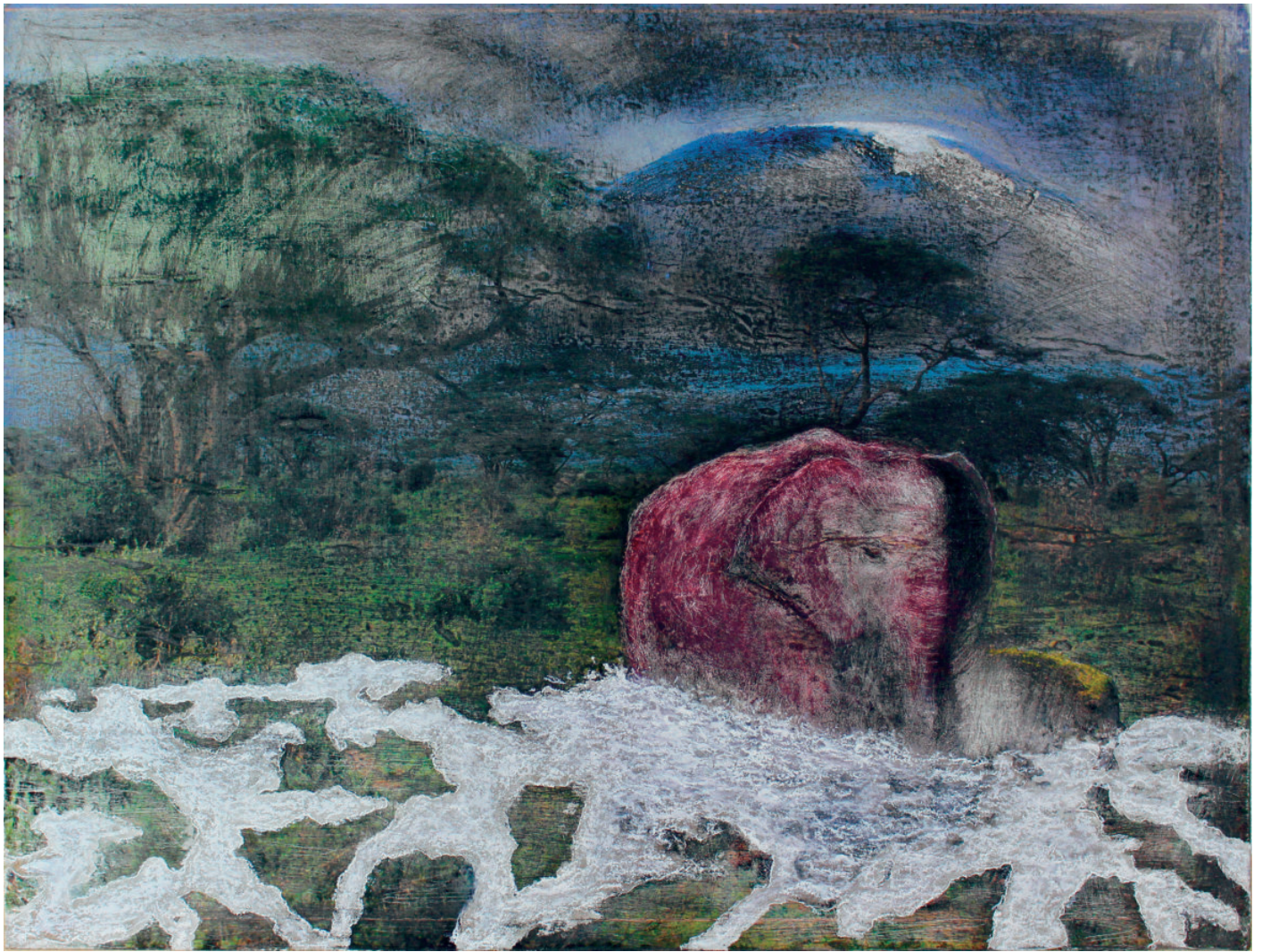
Montée des eaux/Mt. Kilimandjaro(1) pastel gras et technique mixte sur poster contrecollé sur panneau 80 x 60 x 1,6 cm 2018