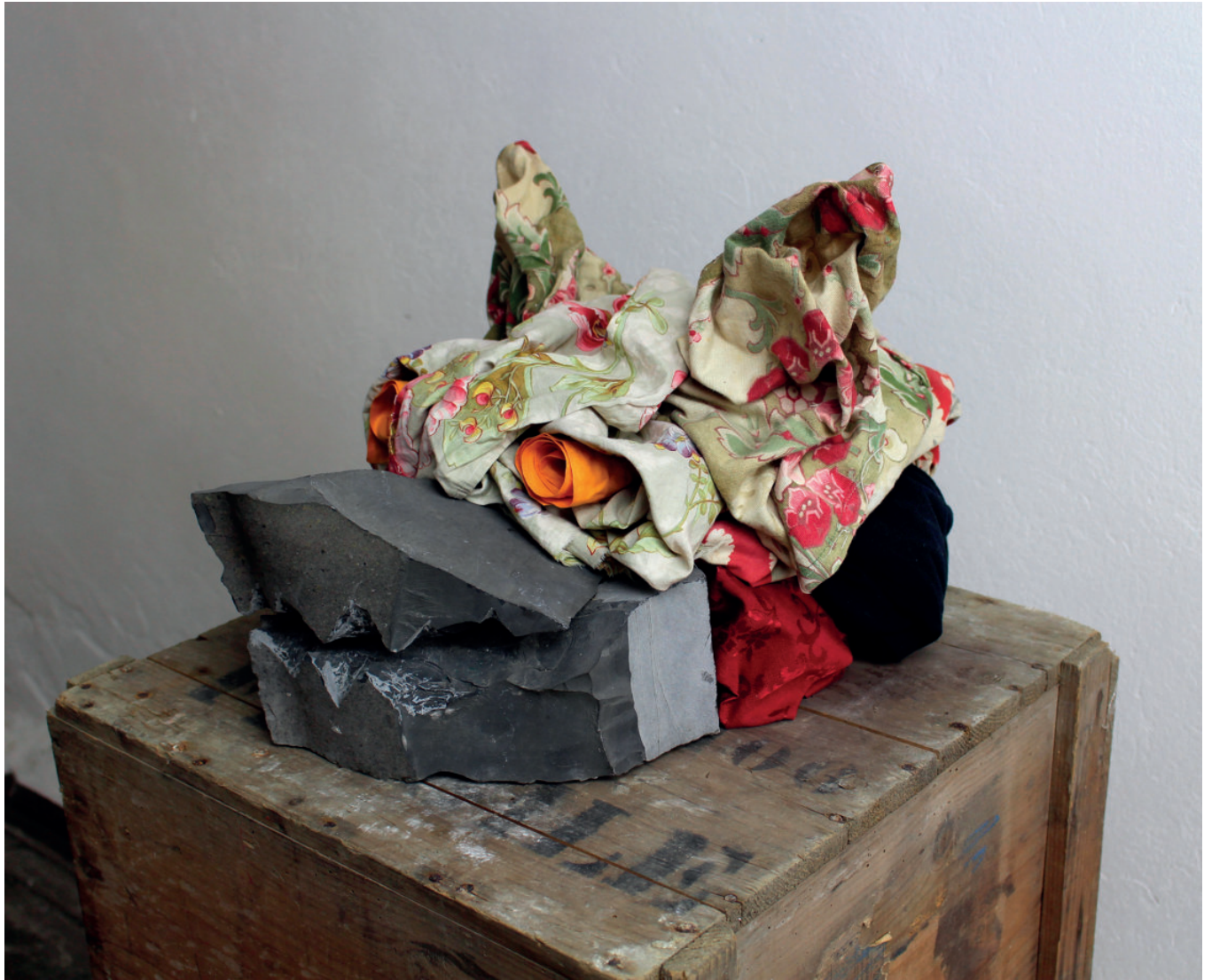
Ne nous en laissons pas conter marbre noir et tissus sur caisses en bois env. 51 x 51 x 130 cm 2019